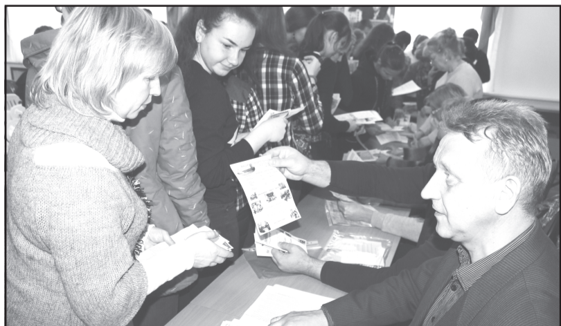
Школьники проявили большой интерес к учебным заведениям, в которых хотели бы учиться

Выбор профессии является одним из главных решений, которые человеку предстоит предпринять в жизни. Как подойти к выбору профессии? Как найти ту, чтобы была по душе и приносила пользу и тебе, и обществу? Над этими вопросами совсем скоро придется задуматься учащимся и девятих классов, и одиннадцатиклассникам. Им предстоит сделать выбор учебного заведения, где будут получать профессиональное образование.